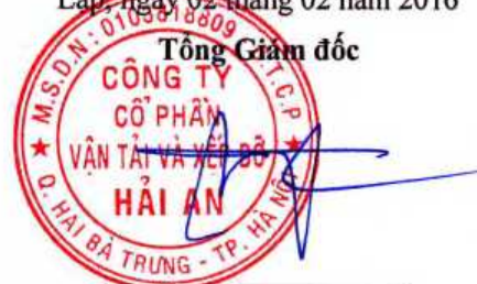
Tạ Mạnh Cường