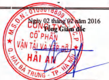
Tạ Mạnh Cường